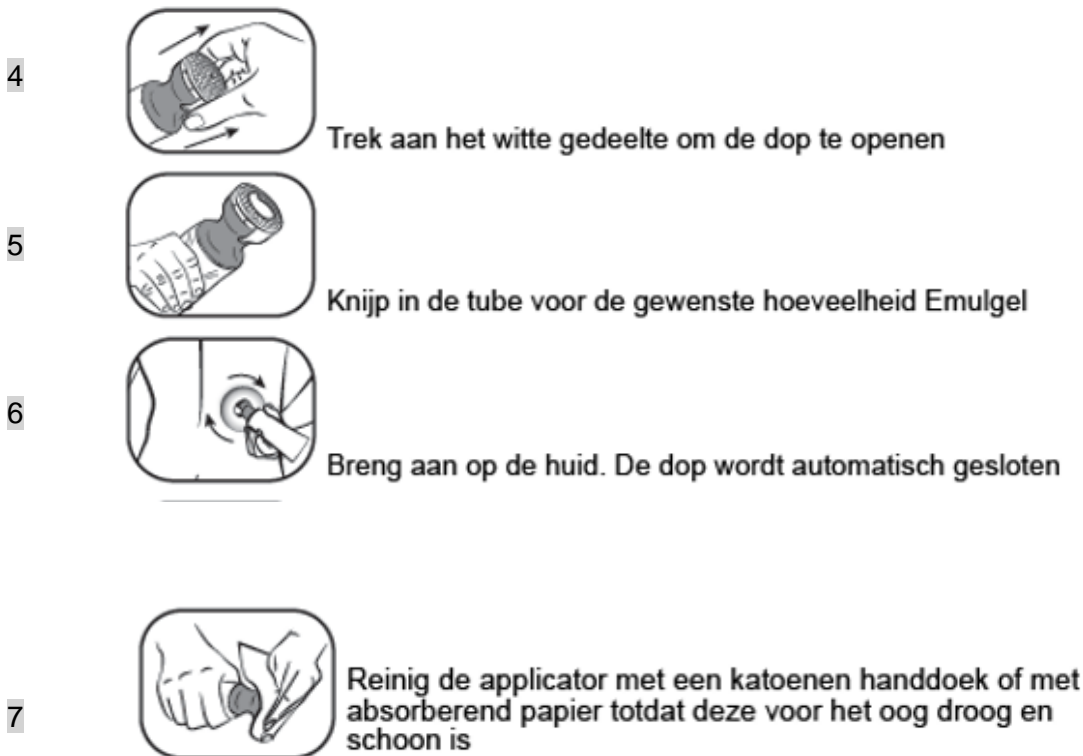
Figuur 2: Doseer- en smeerdop instructie stap 4 t/m 7

Gebruik de applicator niet opnieuw voor een andere tube. Volg bij het weggooien van de tube de in uw land geldende regels voor het weggooien van medicijnen.